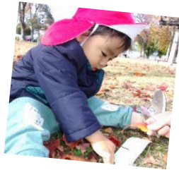
「おしゃれな冠のできあがり！！」