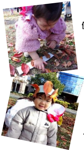
「指先や手の平を使ってぺたぺた」

いよいよ本格的な冬が到来し、森下公園桜の葉も風が吹くと沢山落ちてきます。両面テープ付きの帯に自分で拾った葉を貼り付け冠作りを楽しみました。保育園に戻っても取るのを嫌がるほどお気に入りの子もいました。