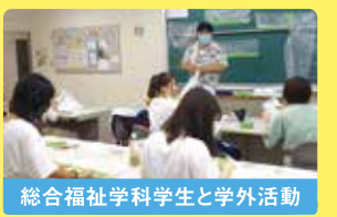
総合福祉学科学生と学外活動

このコロナ禍では、総合福祉学科の学生と一緒に使い捨てガウンの制作を行い、医療従事者へ寄贈しました。また、福祉系学科と共同で子どもたち向けだけでなく、幅広い年齢層に向けた寄付活動やボランティア活動等も行っていきます。このような活動を通じ、社会性も身につけます。