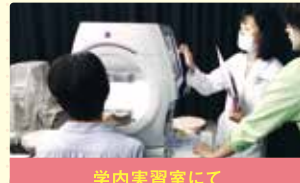
学内実習室にて 教職員・学生眼科検診実習