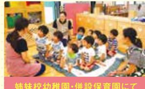
姉妹校幼稚園・併設保育園にて ことも発達段階学習

福祉系他学科を活かした乳幼児から高齢者までの患者様への対応を学び、就職後にも役立つ知識・技術を身につけます。