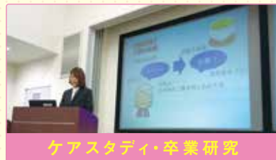
ケーススタディ・卒業研究

1、2年次「介護実習」:高齢者や障がい者の方に寄り添い生活介護や家事援助等の実習(12週間/4回)、3年次「社会福祉実習」:社会福祉に関する相談援助や連絡・調整の実習(6週間/2回)