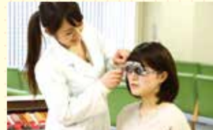
コミュニケーションを学ぶ!

患者様と接することで、医療現場に必要なコミュニケーション力を磨くこともできます。