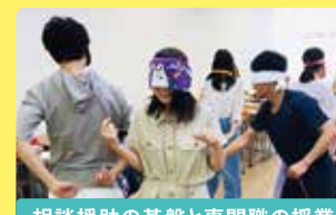
相談援助の基盤と専門職の授業

福祉業界では横のつながりはもちろん、縦のつながりもとても重要です。総合福祉学科では、他学年との合同授業を年に数回行っています。また、3学年合同ゼミナールは学生が全て企画・運営を行います。在学中は実習や課題についての悩みを相談したり、卒業後も就職先や地域活動で一緒になったり。連携やチームビルディングを学ぶよい機会となっています。