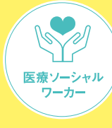
医療ソーシャルワーカー

保健・医療 入院中や社会復帰後の経済圏の不安解消や生活の質の確保について、患者様やそのご家族に対応します。