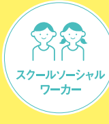
スクールソーシャルワーカー

児童・教育 家庭や学校での児童、生徒の問題に対応するとともに、その取り巻く環境の改善にも取り組みます。