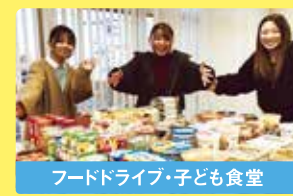
フードドライブ・子ども食堂

主に静岡市内の数か所に分かれて、活動しています。家庭で余っている食べ物を施設等に寄贈したり、子どもや親子を対象に食事の提供の手伝いを行っています。また、保育教材を使用した遊びを子どもたちに提供するなど各学科特性を活かした活動に繋がっています。