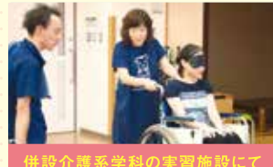
併設介護系学科の実習施設にて 介護実技実習授業