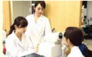
チームでの連携を学ぶ!

静岡県眼科医会の協力のもと、静岡県内の病院、クリニックで実習を行い、医療現場で活躍できる実践力を身につけます。