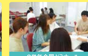
3学年合同ゼミナール

VRを活用して認知症の方が見ている世界を疑似体験し、利用者様の立場に立った支援を行えるように学びます。