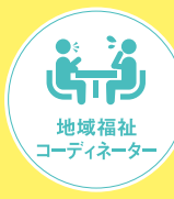
地域福祉コーディネーター

地域・行政 高齢や障がい、所得の問題など、地域住民のさまざまな困りごとに対して、相談援助を行います。