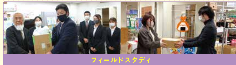
フィールドスタディ

2年次、3年次には実習で得られた対人援助の総括、各分野で実証的な研究を通し、様々な団体や施設等でフィールドワークを行った結果をプレゼンテーション。卒業後の大きな自信に繋がります。