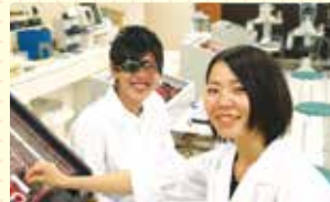
実践的な知識を深める!