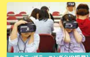
アクティブラーニング(VR授業)

相談援助職には様々な専門スキルが必要です。授業の中でコミュニケーション力等を実践的に磨き、現場実習で自分の力にします。