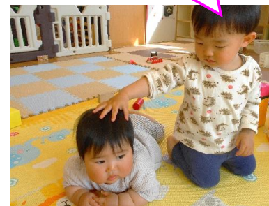
【おともだち だいすき!】