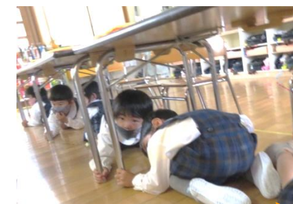
【机の下に入って頭を守るよ】