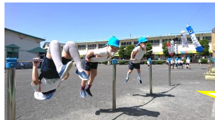
【逆上がりができるようになったよ！】

子どもたちは、外遊びが大好きです。本園自慢の広い園庭で思い切り体を動かし、元気いっぱい伸び伸びと遊ぶ子どもたちは、畑で野菜や花を育て、成長を楽しみながら、「思いやりをもって育てる」気持ちを育てています。