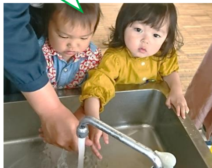
【てあらいをしましょうね】