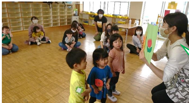
【かざりをつくりましょう】

子どもたちはもちろんのこと、保護者の皆様同士のお友達作りもできます。子育ての不安・心配事を相談し合いながら、様々な遊びをお子様と一緒に体験し、楽しいひとときを過ごしませんか？