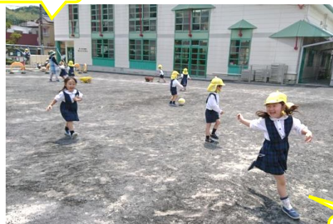
【おいかけて楽しいね】