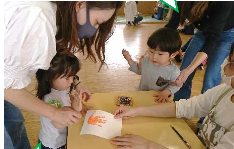
【えのぐであそびましょう】