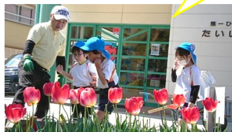
【園庭の畑が華やかになったね！】