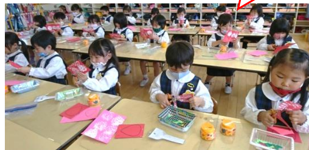
【いちごの絵を教室に飾ったよ！】