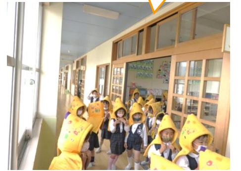
【おしゃべりしないで素早く避難！】