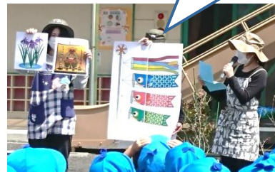
【こどもの日の由来を学んだよ】