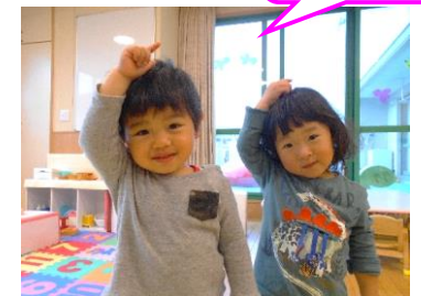
【ふたりは なかよし】

毎日げんきいっぱい! かわいい笑顔が広がる「キッズハウスよいち」のお友だちです。