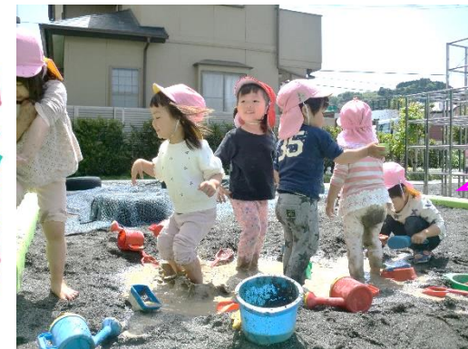
【どろんこあそび たのしいね】

最初は泥んこに触ることをためらっていた子も、あっという間に砂やお水となかよしになりました!