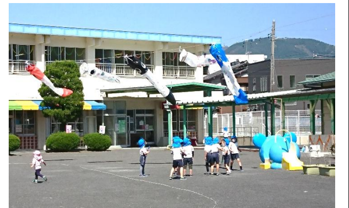
【こいのぼりが元気に泳いだよ】