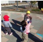
寒い日でもお外で元気いっぱい！