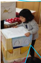
トンネルコースを 作って探検だ～！