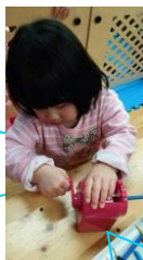
パズルもできるよ！