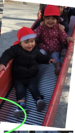
ポカポカあったか ピクニックごっこ♪