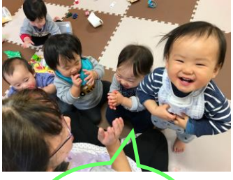
うん！ ちょーち ちょーち