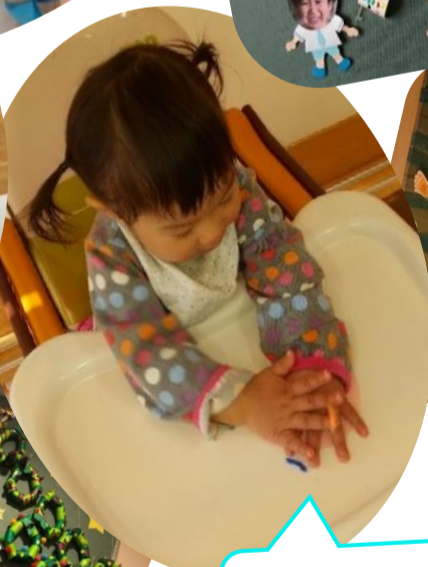
フワフワギュッギュッ!