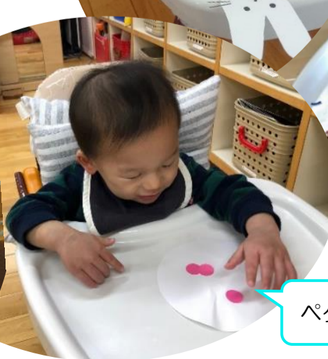
ペタッ!くっついた!