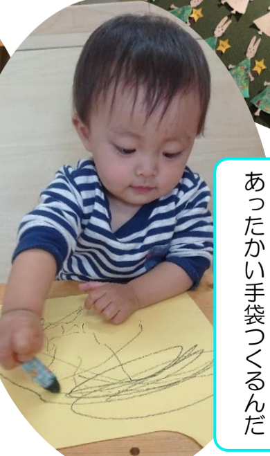
あったかい手袋つくんだ