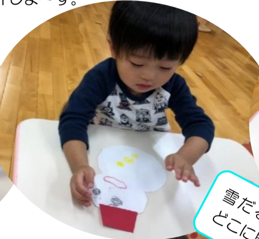
雪だるまのぼうしどこに貼ろうかな