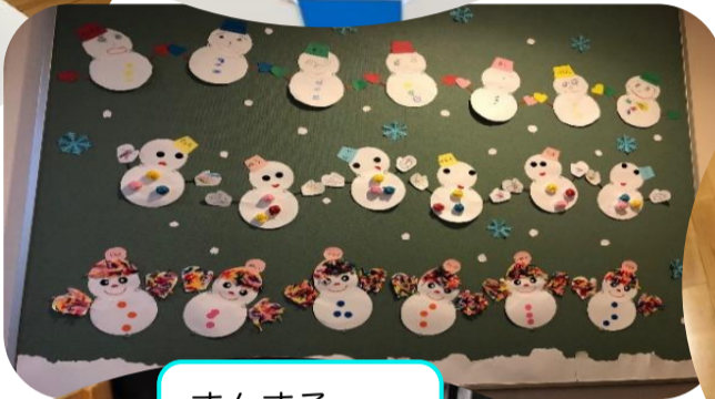
まんまるくしゅくしゅ