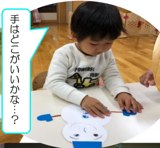
手はどろろがいかな…?