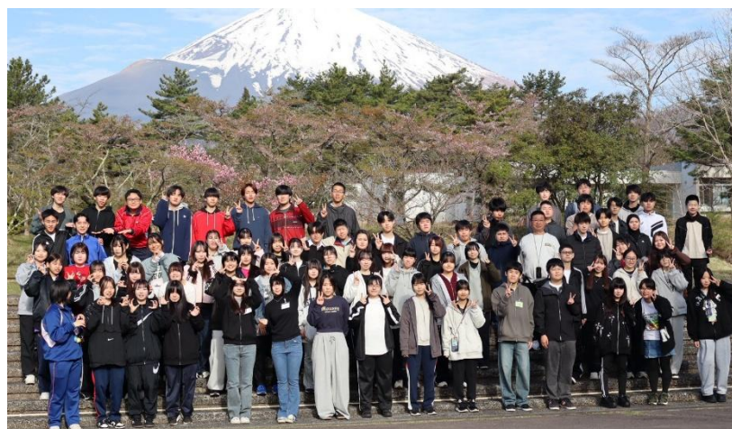
令和8年4月13日(月)～ 4月15日(水)